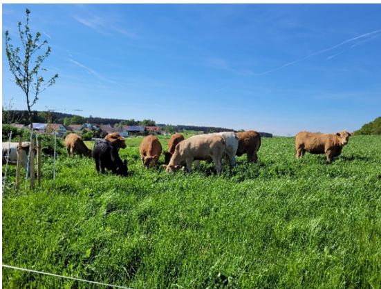
Gesunder Boden, gesunde Pflanzen, gesunde Tiere = leistungsstarker Betrieb

(Bekanntmachung im Landwirtschaftlichen Wochenblatt und auf www.biohofdonderer.de ) Einzelbetriebliche Beratung nach Vereinbarung auch möglich.