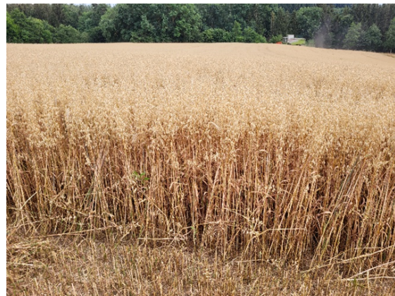
Hafer reagiert besonders gut auf DiaBas Urgesteinsmehl