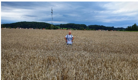
Gute Erträge dank fruchtbarem Boden