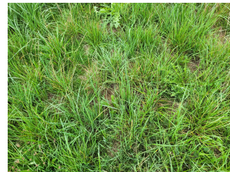
Ohne DiaBas-Urgesteinsmehl behandelte Gülle