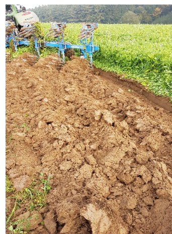
Ein garer Boden Dank Donderers Zwischenfruchtmischung (Leguminosen zur Stickstoffsammlung)